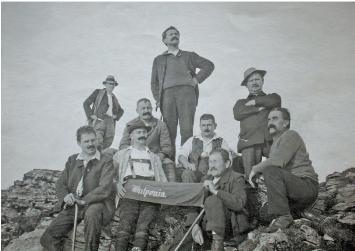
Wulponiten auf Berggipfel mit Wulponia- Banner