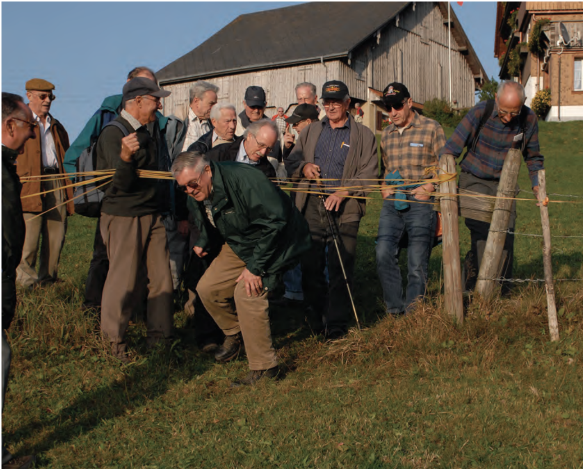
Auch Wulponiten müssen mal «unten durch»